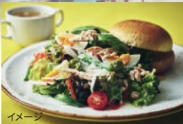
北軽バンバーニャ (二ニス風サラダ&サンドイッチ)