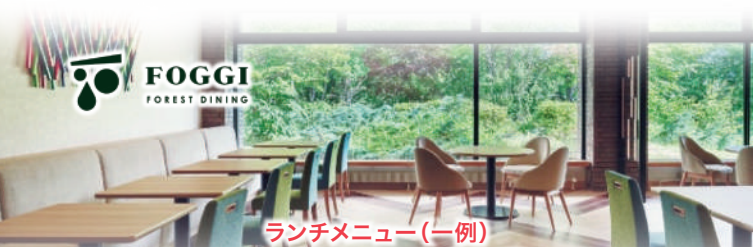
ランチメニュー(一例)